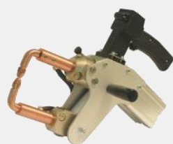
CAR POINT 11 RF GUN