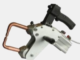
CAR POINT 8 GUN